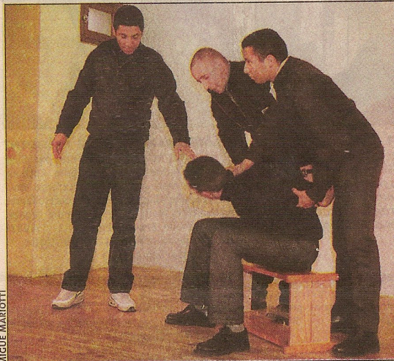
Des dialogues basés sur les expériences vécues.

Inspirées de faits vécus par les participants, ces scènes ont été inventées, jouées, puis sobrement mises en scène dans un atelier intitulé